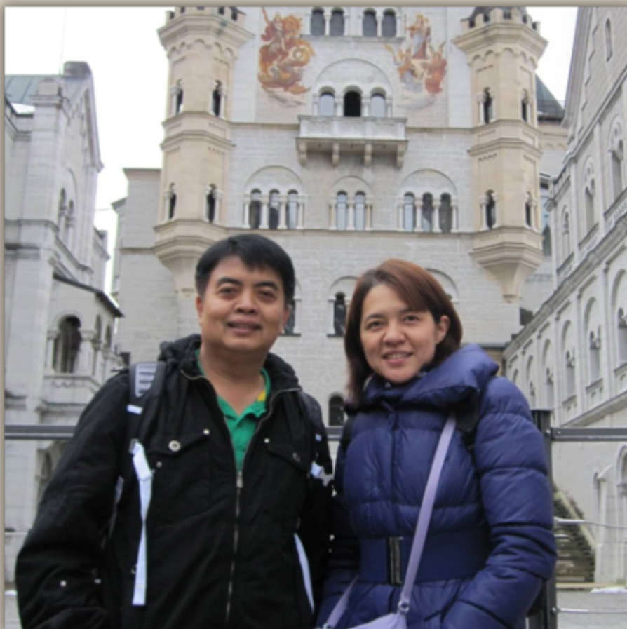
สหพันธ์สาธารณรัฐเยอรมนี