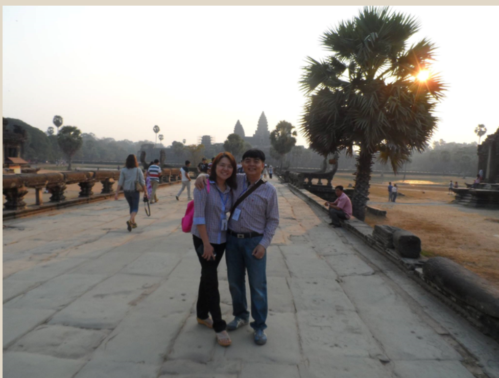
ราชอาณาจักรกัมพูชา