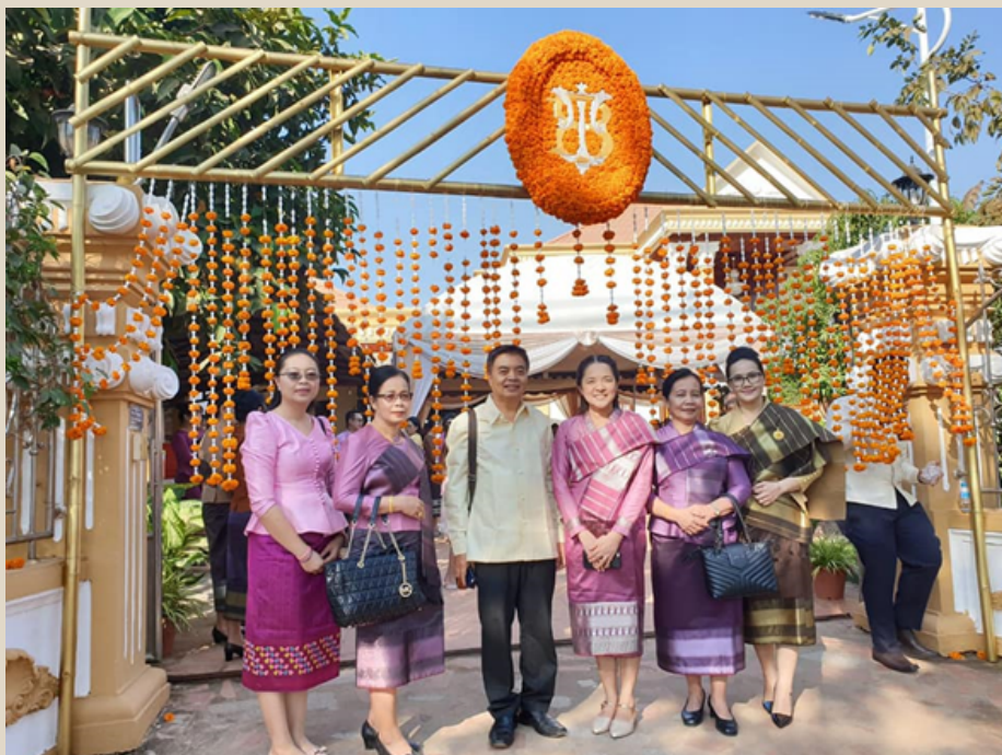
สาธารณรัฐประชาธิปไตยประชาชนลาว