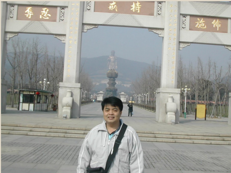
สาธารณรัฐประชาชนจีน