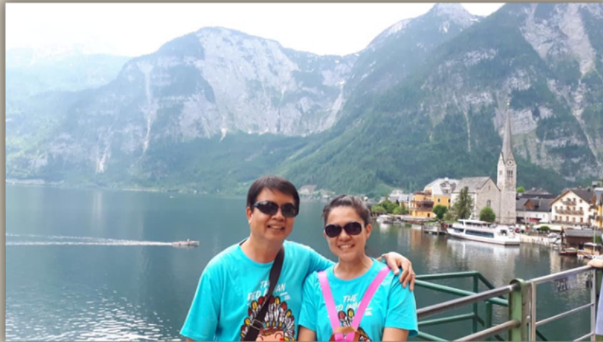
สาธารณรัฐออสเตรีย