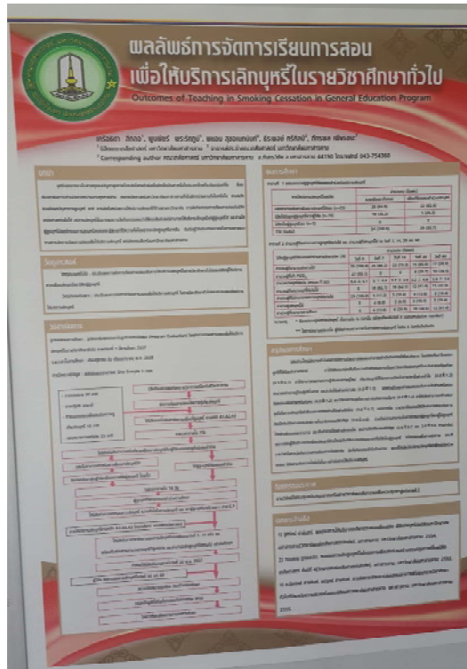
รางวัลรองชนะเลิศอันดับ 3